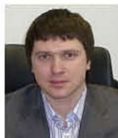
Автор проекта: архитектор и руководитель Игорь Леоновец (строительная компания «Люкс Хаус»)

Древесина сосны, использованная в качестве строительного материала, в отделке внутренних пространств, а также как основа простой и элегантной мебели, не только придает образу целостность, но и за счет тепла напоминает о солнечных днях.